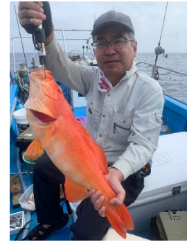
（4月末まぐれのアカジン、嬉しさのあまり検量をし 忘れましたが、40cm以上はありました。）