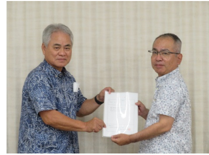
（小濱支部長からの辞令交付）

最後に趣味として月1程度船で沖釣りを楽し んでおります。船釣りのお誘い等の情報大歓迎で しますのでよろしくお願い致します。