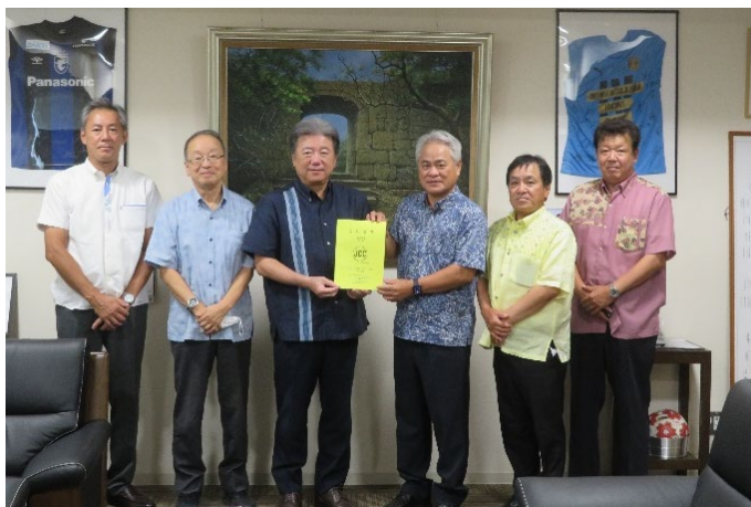
〈左から3人目が浜田中城村長〉