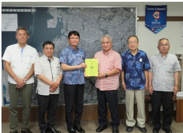
〈左から3人目が知念那覇市長〉

7月7日、四役の内6名で読谷村役場、嘉手納町役場、沖縄市役所、うるま市役所、北中城村役場、中城村役場を訪問。