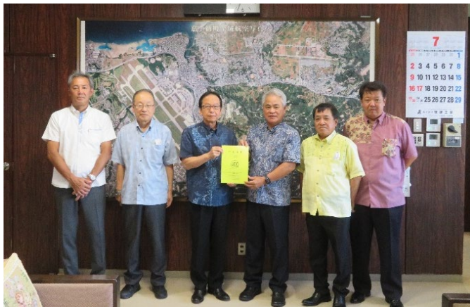
〈左から3人目が當山嘉手納町長〉