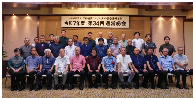
(総会後の記念撮影)