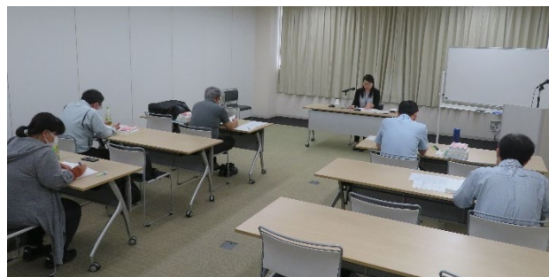
(共通科目研修の様子)

5月27日から29日、補償業務管理士共通科目研修が自治会館にて行われました。受講生は5名でした。10月の筆記試験に向け頑張ってください。