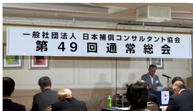
(議長を務めた玉那覇副支部長)