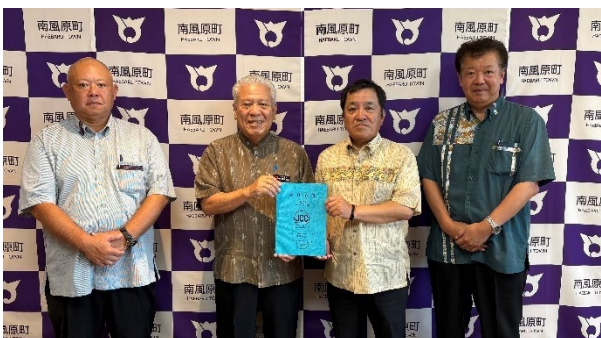
(左から2番目が赤嶺南風原町長)