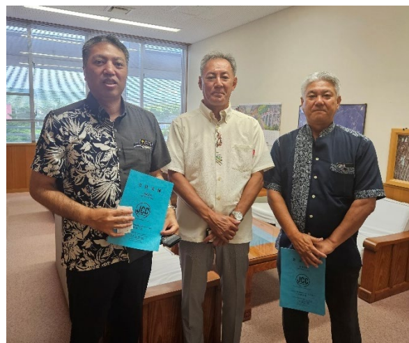
(左から1番目が又吉東村副村長)