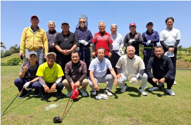
（スタート前集合写真）