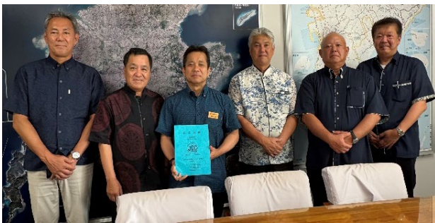
(左から3番目が仲本南部土木所長)