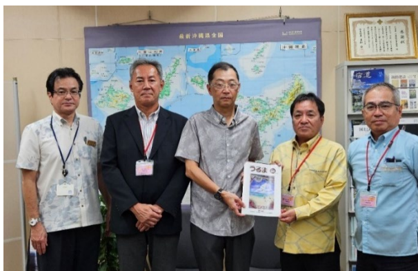
(中央が逢坂沖縄総合事務局次長、左から1番目が伊波用地課長)