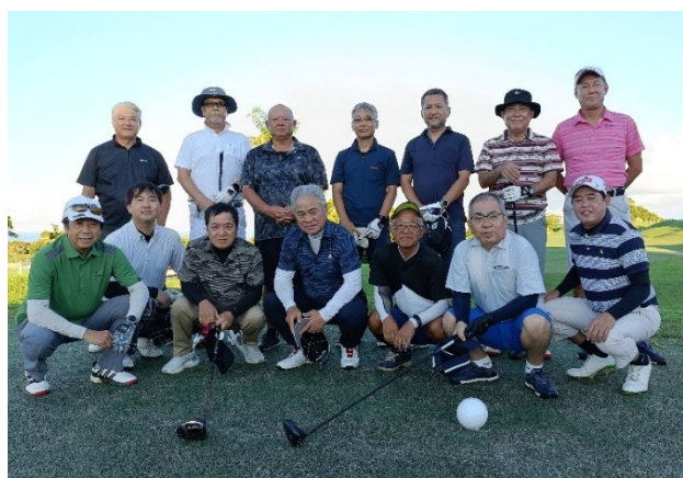
(スタート前集合写真)