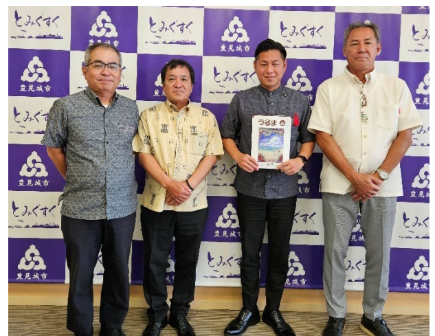
(右から2人目が徳元豊見城市長)

10月23日(木)豊見城市役所、10月28日(火)石垣市役所、八重山土木事務所、竹富町役場、宮古島市役所、宮古土木事務所、10月31日(金)北部国道事務所、北部土木事務所、名護市役所、中部土木事務所、沖縄市役所、宜野湾市役所、浦添市役所、南城市役所、糸満市役所、11月4日(火)南部土木事務所、沖縄県土地開発公社、11月25日(火)沖縄総合事務局及び南部国道事務所、11月28日(金)宜野座村役場、恩納村役場、読谷村役場、嘉手納町役場、北谷町役場、那覇市役所、沖縄県用地課へ「うるま40号」等を配布し支部会員の活用を要請しました。