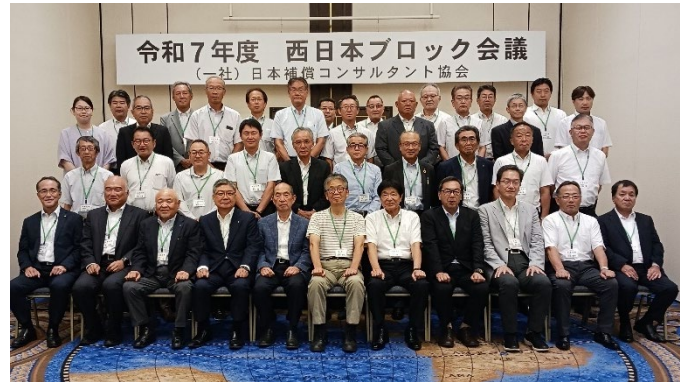
(会議後の集合写真)