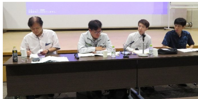
（左から、宮良委員、新川委員、新垣委員、與儀委員）