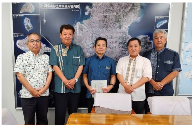
(中央が仲本南部土木所長)